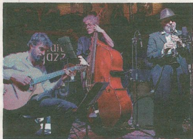
Il trio Quai Des Brumes questa sera all'Osteria a Ferrara

Nelle serate di oggi e domani al cinema Boldini, in via Previati 18 a Ferrara, verrà proiettato (dalle ore 21) il film "Roma" di Alfonso Cuarón, in sua originale con sottotitoli in italiano. Il film, Leone d'oro al recente festival del Cinema di Venezia, ambientato negli anni '70 a Città del Messico, racconta un anno turbolento della vita di una famiglia borghese.